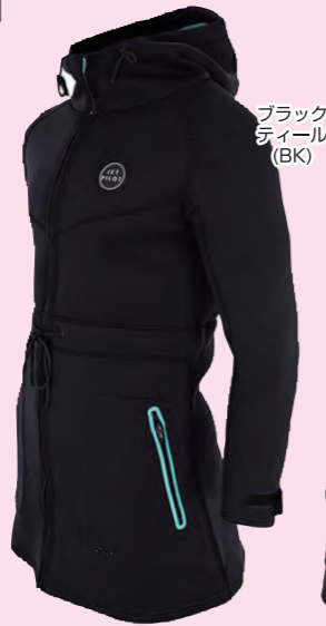
ブラック ティール (BK)

ひざまである長めの丈は、防寒性に優れ、風にさらされるデッキやマリンフィールド等で体温をキープしてくれます。