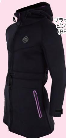
ブラック ピンク (BP)

2 TOUR COAT ツアーコート 注文品番 JA21264 | BK | サイズ 注文品番 JA22264 | BP | サイズ ¥27,280 (税抜 ¥24,800) ●サイズ/ 10(M)、12(L)